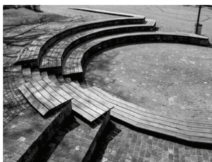
Vergängliches Werk (Kawamata, Zug)

gebaute, rote Theaterturm auf dem Julierpass. Auch nur befristet steht der weisse Turm in Mulegns, der weltweit grösste, von der ETH mittels 3D gedruckte Turm. Hier sind die modernen Kunstwerke vergänglich, erhalten bleiben die historischen Bauten, wie etwa das Hotel Löwe in diesem Dorf. Auch in nächster Nähe am Zugersee haben wir eine