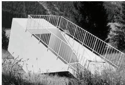
Verschwundenes Werk (Kippenberger, Zuoz)